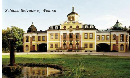
Schloss Belvedere, Weimar