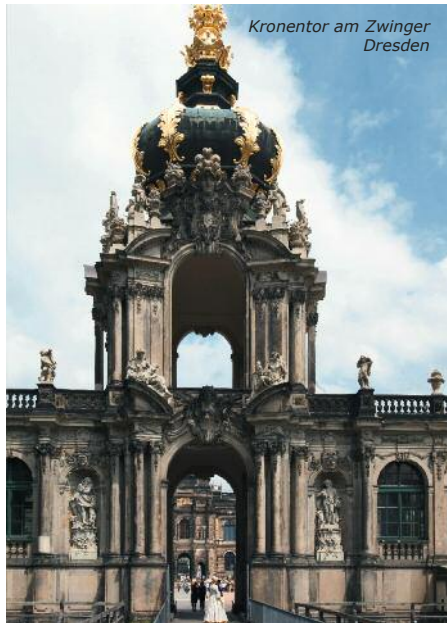
Kronentor am Zwinger Dresden

Durch die hervorragende Lage zwischen Pirna und Bad Schandau hat sich Königstein und seine Umgebung zur Perle an der Elbe entwickelt. Hier im Herzen des Elbsandsteingebirges befindet sich unser Jugenddorf. Auf dem 9 ha großen Gelände finden Sie zahlreiche Freizeit- und Sportmöglichkeiten (Tischtennis, Volleyball-, Bolz- und Abenteuerspielplatz u. v. m.). Die Unterbringung erfolgt in Bungalows für bis zu 13 Personen, welche alle mit Du/WC eingerichtet sind. Betreuer erhalten separate Zimmer in den Bungalows.