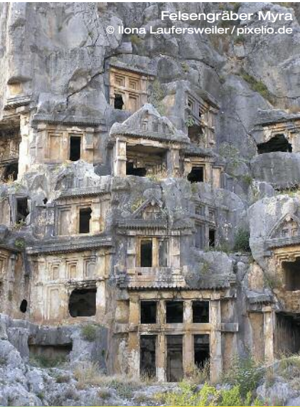
Felsengräber Myra