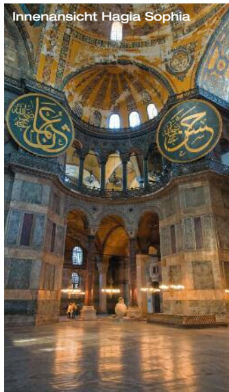
Innenansicht Hagia Sophia