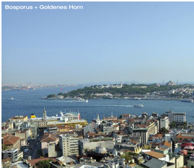
Bosporus + Goldenes Horn