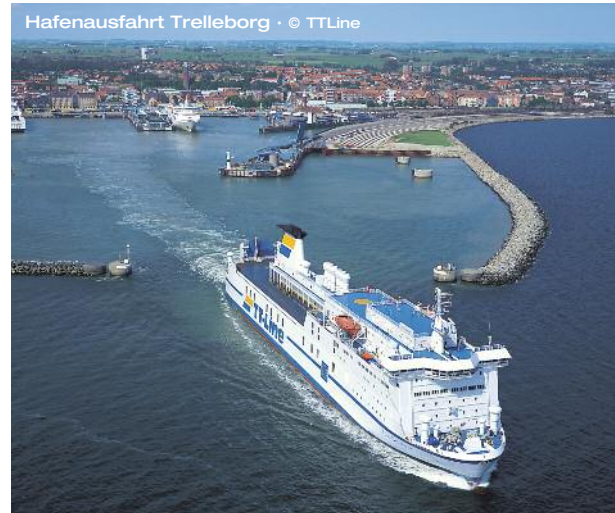
Hafenausfahrt Trelleborg