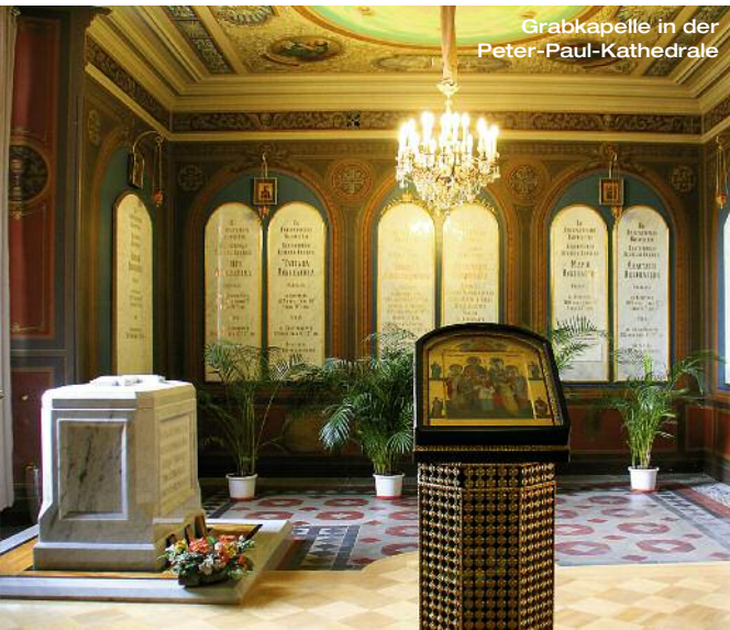
Grabkapelle in der Peter-Paul-Kathedrale