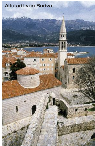
Altstadt von Budva