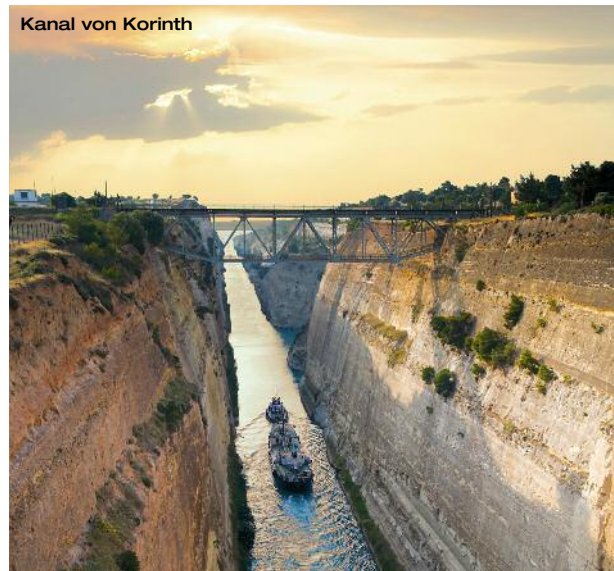
Kanal von Korinth