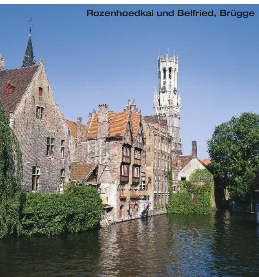
Rozenhoedkaai und Belfried, Brügge