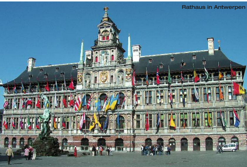
Rathaus in Antwerpen