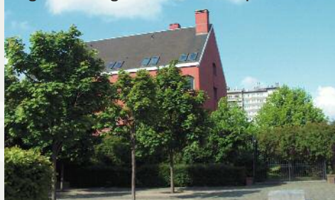
Jugendherberge Génération Europe