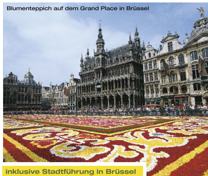
Blumenteppich auf dem Grand Place in Brüssel