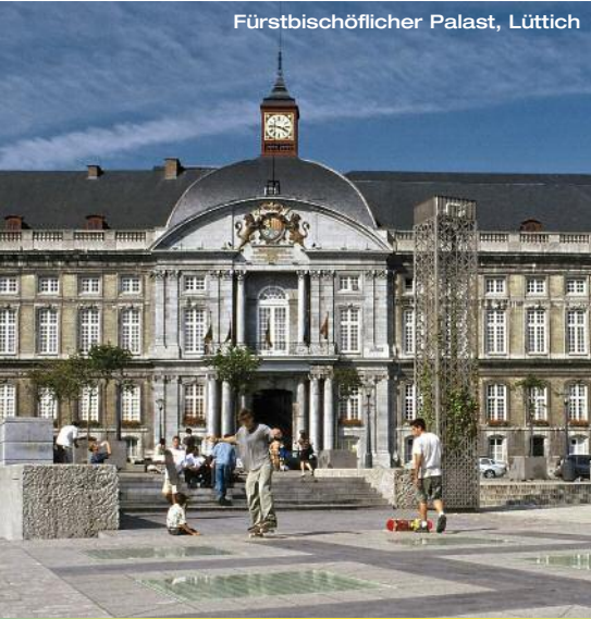
Fürstbischöflicher Palast, Lüttich