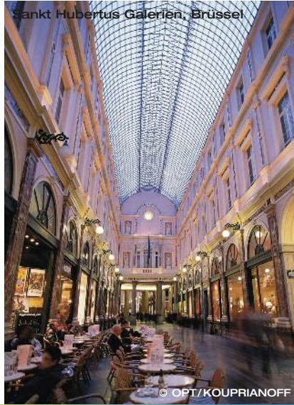
Sankt Hubertus Galerien, Brüssel