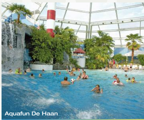
Aquafun De Haan