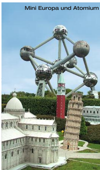
Mini Europa und Atomium