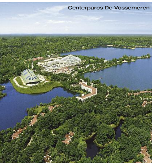
Centerparcs De Vossemeren