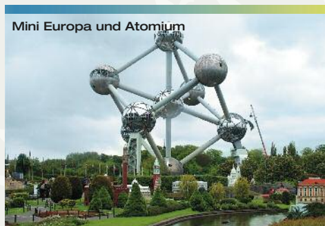
Mini Europa und Atomium

In der Gegend am Bahnhof lebt die größte jüdische Gemeinde Europas. Im „Jerusalem an der Schelde“ wohnen die Chasidim, die frömmsten Juden. Erleben Sie ein Stück jüdisches Osteuropa und zugleich orthodoxes Jerusalem bei einer geführten Tour mit unserem qualifizierten Guide. (ca. 2 Stunden, 90,- € pro Gruppe bis 20 Personen)