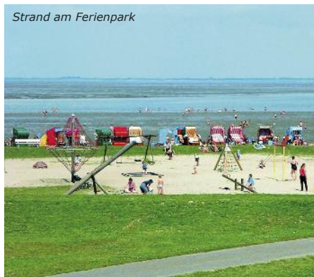
Strand am Ferienpark

Die Lage dieses Ferienparks ist einmalig! Unmittelbar am Nationalpark Wattenmeer und nur 200 m von der Nordsee entfernt wohnen Sie in komfortablen Ferienhäusern für 4 – 8 Personen. Alle Häuser sind mit einem Wohn-/Essbereich, einer kompletten Küche, mehreren Schlafzimmern, TV, Bad mit Dusche und WC sowie einer Terrasse ausgestattet. Betreuer erhalten separate Häuser mit Du/WC. Im Market Dome stehen Ihnen verschiedene Restaurants, Cafes und ein kleiner Supermarkt zur Verfügung. Die zahlreichen Freizeitangebote auf dem Gelände sorgen für eine rundum gelungene Klassenfahrt, u. a. Tennis-, Squash-, Badminton- und Beachvolleyballplätze, Tischtennis, Kegel- und Bowlingbahn, Bogenschießen, Minigolf, Billard und Fahrradverleih (tw. gegen Gebühr).