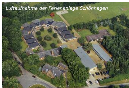
Luftaufnahme der Ferienanlage Schönhagen

Herrlicher Sandstrand, das Rauschen des Meeres, Leuchttürme und das Geschrei der Möwen – dieses Erlebnis bietet nur die Ostsee! Egal ob Party am Strand, Spaß am Grillplatz oder eine Speedbootfahrt – Spaß und Action sind garantiert.