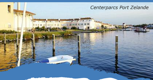
Centerparcs Port Zelande