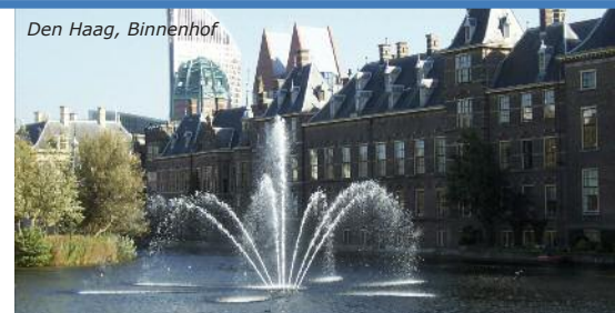
Den Haag, Binnenhof

5. Tag: Beginn der Rückreise nach dem Frühstück; Ankunft im Schulort gegen Nachmittag/Abend.