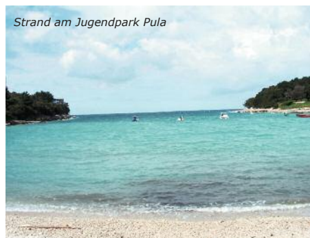
Strand am Jugendpark Pula

Jugenderfahrene Anlage; attraktiv in einer Bucht, direkt am Strand gelegen. Sie wohnen in Bungalows mit jeweils 4 Mehrbettzimmern bzw. auf Anfrage Mobilhomes mit je zwei 4-Bettzimmern, Du/WC; Tischtennis, Restaurant, Aufenthaltsraum, Disco und Sportflächen befinden sich in der Anlage bzw. in näherer Umgebung.