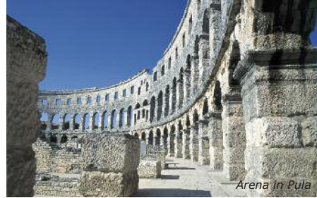
Arena in Pula