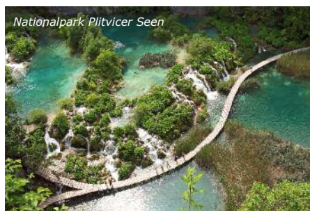
Nationalpark Plitvicer Seen

6. Tag: Sie treffen wieder im Schulort ein.