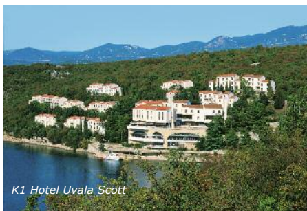
K1 Hotel Uvala Scott

In einzigartiger Panoramalage zwischen Krk und dem Festland, unweit der gigantischen Festlandbrücke, wohnen Sie in einer großzügigen Anlage direkt an der Küste in Mehrbettzimmern/Appartements mit Du/WC. Betreuer werden in separaten Zimmern mit Du/WC untergebracht. In der Anlage finden Sie z. B. Restaurant, Tischtennis, Billard, Bar u. v. m. Weiterhin sind Discobesuche und Grillabende möglich! Deutschsprachige Beratung vor Ort.