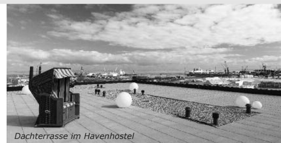
Dachterrasse im Havenhostel