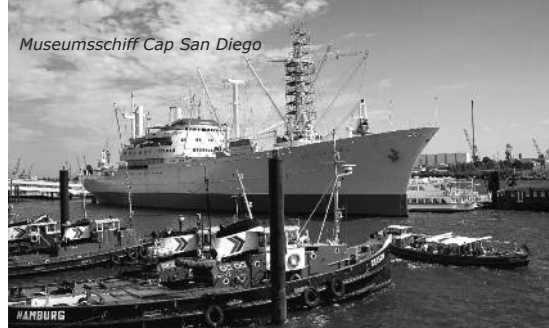
Museumsschiff Cap San Diego