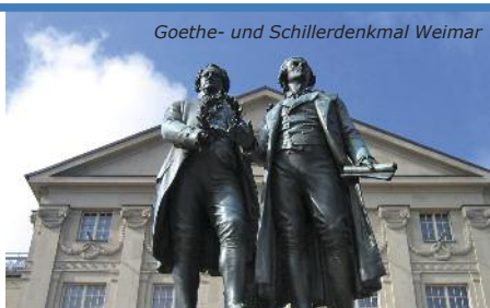
Goethe- und Schillerdenkmal Weimar