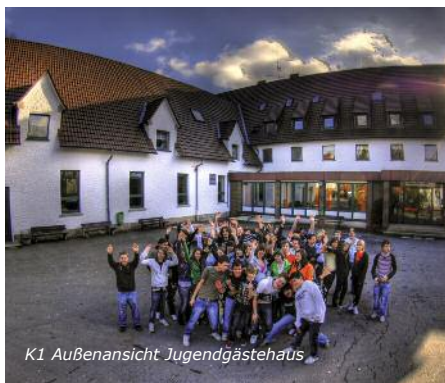
K1 Außenansicht Jugendgästehaus

5. Tag: Nach dem Frühstück Beginn der Heimreise, Ankunft im Schulort gegen Nachmittag/Abend.