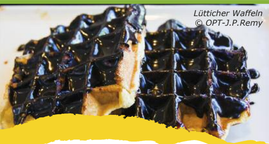
Lütticher Waffeln