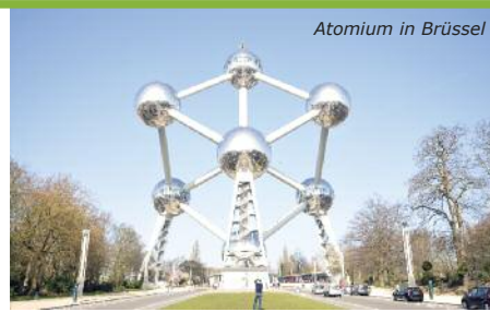
Atomium in Brüssel

Sie wohnen in gemütlichen Ferienhäusern für 6 Personen (alle mit mehreren Schlafräumen, Du/WC, Küche, Esstisch, Sitzecke, TV, Kamin, Terrasse, Grillmöglichkeit und WIFI gegen Aufpreis). Betreuer erhalten separate Ferienhäuser mit Du/WC. Freizeitangebote: u. a. Minigolf, Volleyball, Wasserski, Spaßbad "Aqua Mundo".