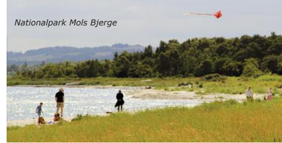
Nationalpark Mols Bjerge