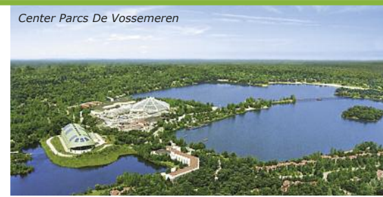
Center Parcs De Vossemere

5. Tag: Beginn der Rückreise nach dem Frühstück; Ankunft im Schulort gegen Nachmittag/Abend.